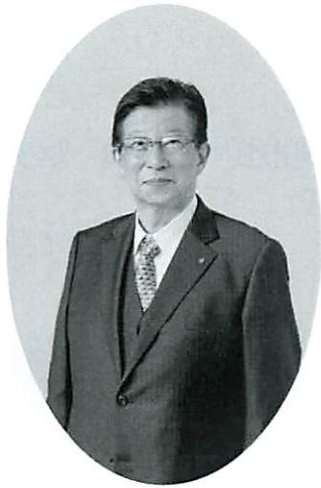
静岡県知事 川勝 平太

第38回全国高等学校新体操選抜大会が、ここ“ふじのくに”静岡県で開催されますこと をお慶び申し上げますとともに、参加される選手並びに関係の皆様を心より歓迎いたします。