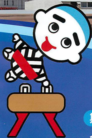
四日市市マスコットキャラクター こにゅうどうくん