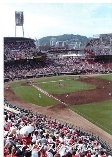
マツダスタジアム