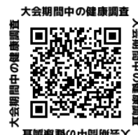
②大会期間中の健康調査

なお、大会前2週間の体温と体調については各個人で記録し、大会運営側が必要と判断し求めた際に速やかに提出できるようにしておいてください。